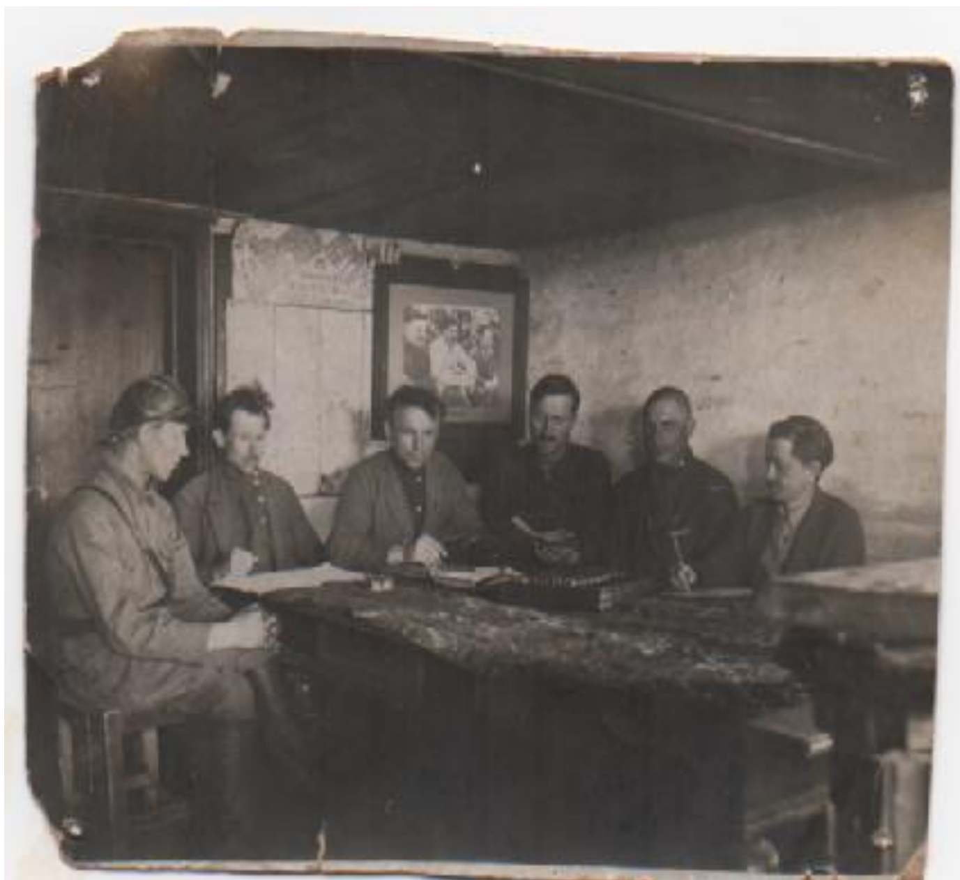
Правление колхоза 1933 год.