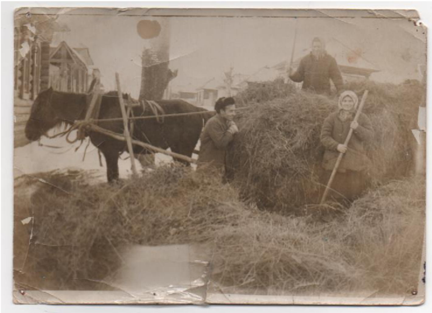
Работа в колхозе.