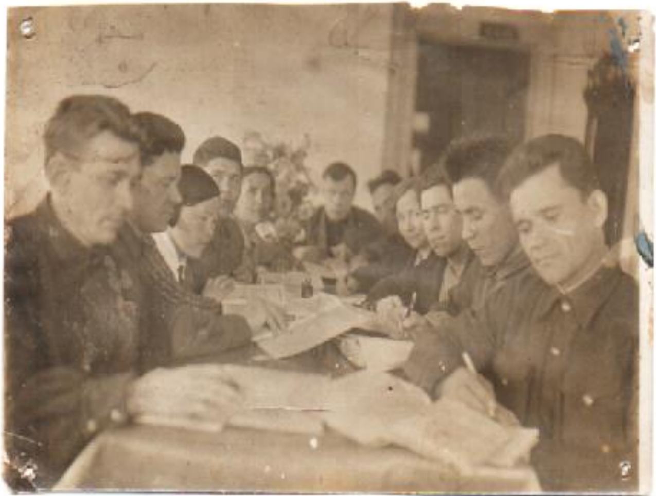
Собрание членов колхоза, 1933г.