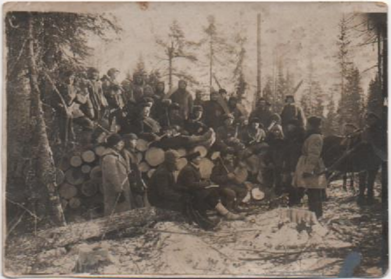
Бригада колхозников на заготовке леса.