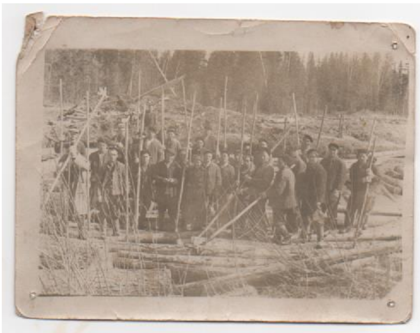
Бригада колхозников на сплаве леса.